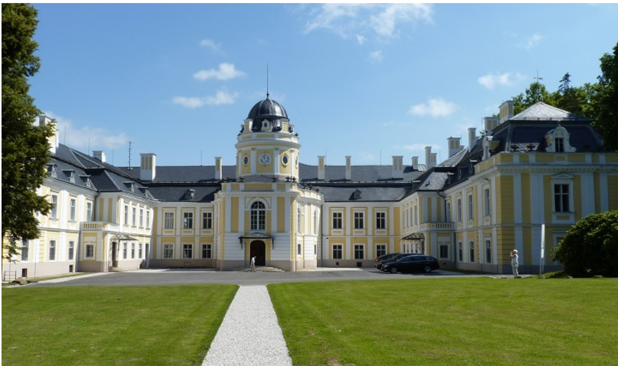
Так виглядає замок у Шілгержовіце сьогодні