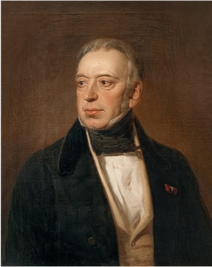
Соломон Маєр Ротшильд