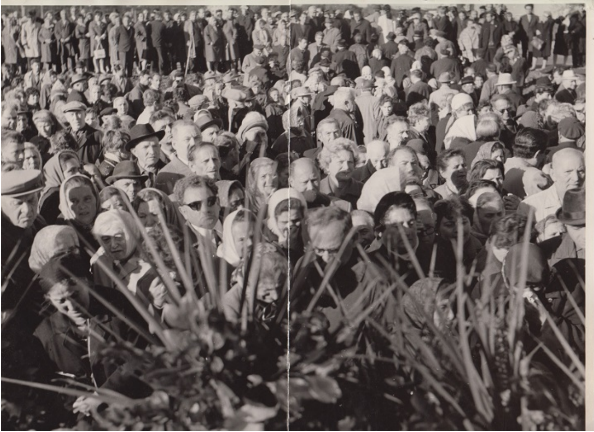
Незаконний мітинг у Бабиному Яру, 1960-і

Україна готується відзначити 80-річчя трагедії Бабиного Яру — одного із символів Голокосту на території колишнього СРСР. Крім державної програми і візитів зарубіжних лідерів, ряд ініціатив готують громадські організації, про що ми ведемо бесіду зі співпрезидентом Вааду України Йосифом Зісельсом.