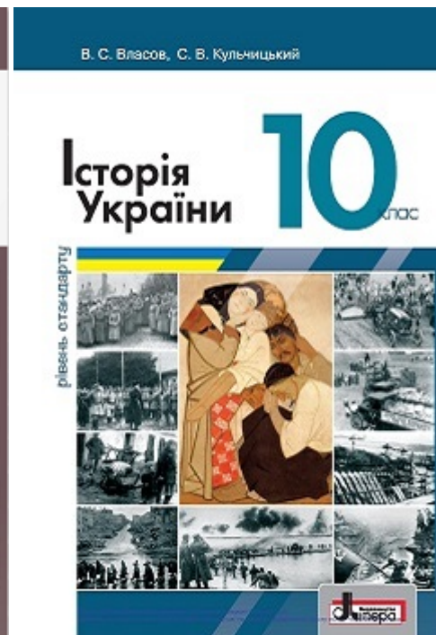
Підручники з історії України, де викладені події Голокосту

Я впевнений, що навіть нечисельні цивільні проекти «врятують честь» України у справі меморіалізації Бабиного Яру.