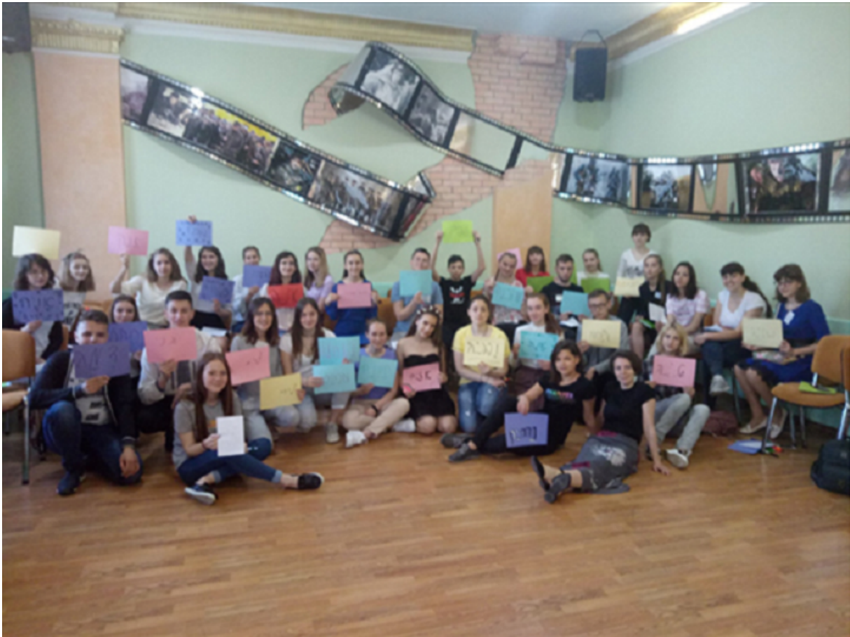
Учасники одного з конкурсів «Історія і уроки Голокосту».

Таким чином, ми принаймні частково спробували виправити переки́с, давши можливість громадянському суспільству взяти участь у підготовці і проведенні меморіальних заходів до цієї сумної дати.