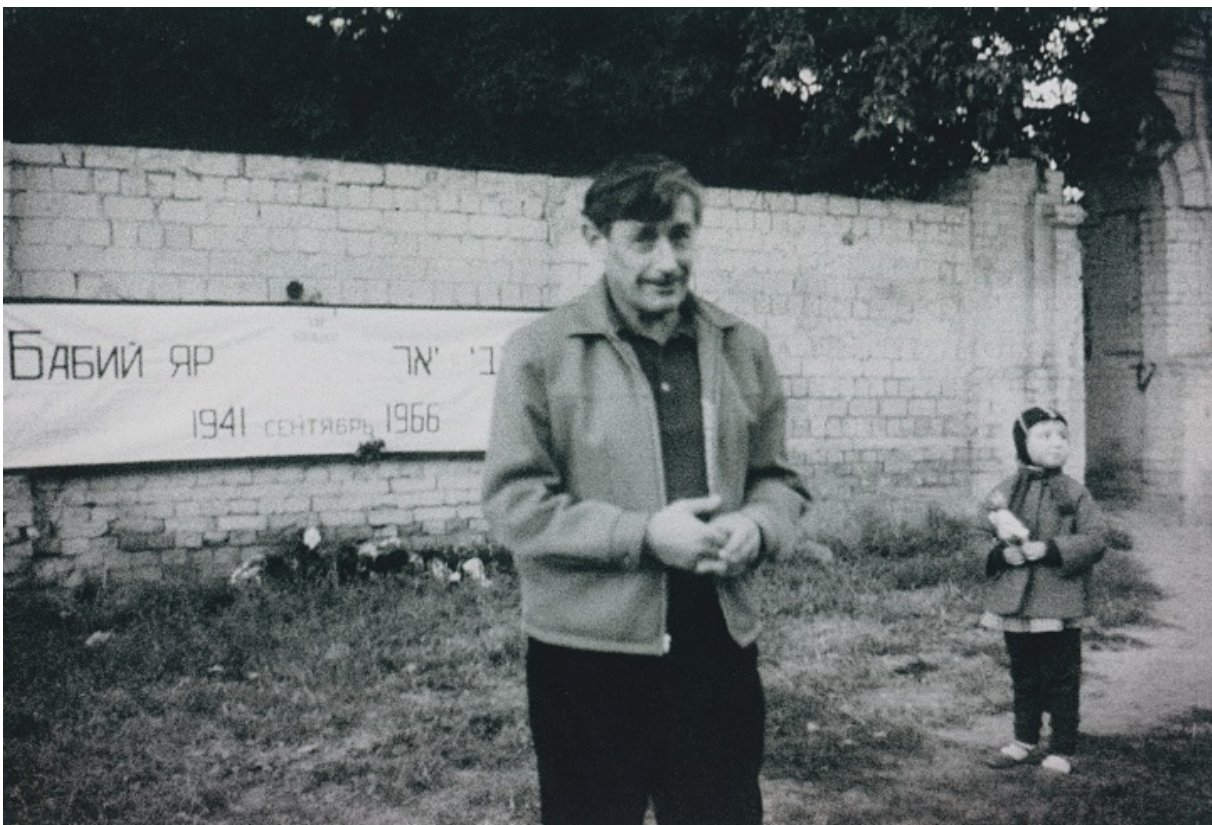
Віктор Некрасов у Бабиному Яру, 1966

Насамперед, ми б хотіли включити трагедію Бабиного Яру в історичний контекст, і в рамках кількогадинного марафону це цілком можливо. Історики, культурологи, експерти розкажуть про коріння нацистської ідеології, буде показано фільм Сергія Буковського «Назви своє ім'я», в основу якого лягли свідчення людей, які пережили Голокост, окремий блок присвятимо боротьбі за пам'ять про Бабин Яр. Це й історія спроб встановлення там пам'ятника, і стихійні збори, в тому числі знаменитий мітинг 1966 року, на якому виступали Віктор Некрасов та Іван Дзюба, і боротьба єврейських активістів за увіковічення пам'яті про трагедію, документи з секретних архівів, доноси в обком партії, КДБ, доля книги Анатолія Кузнєцова, поезія на їдиші та українською і багато іншого.