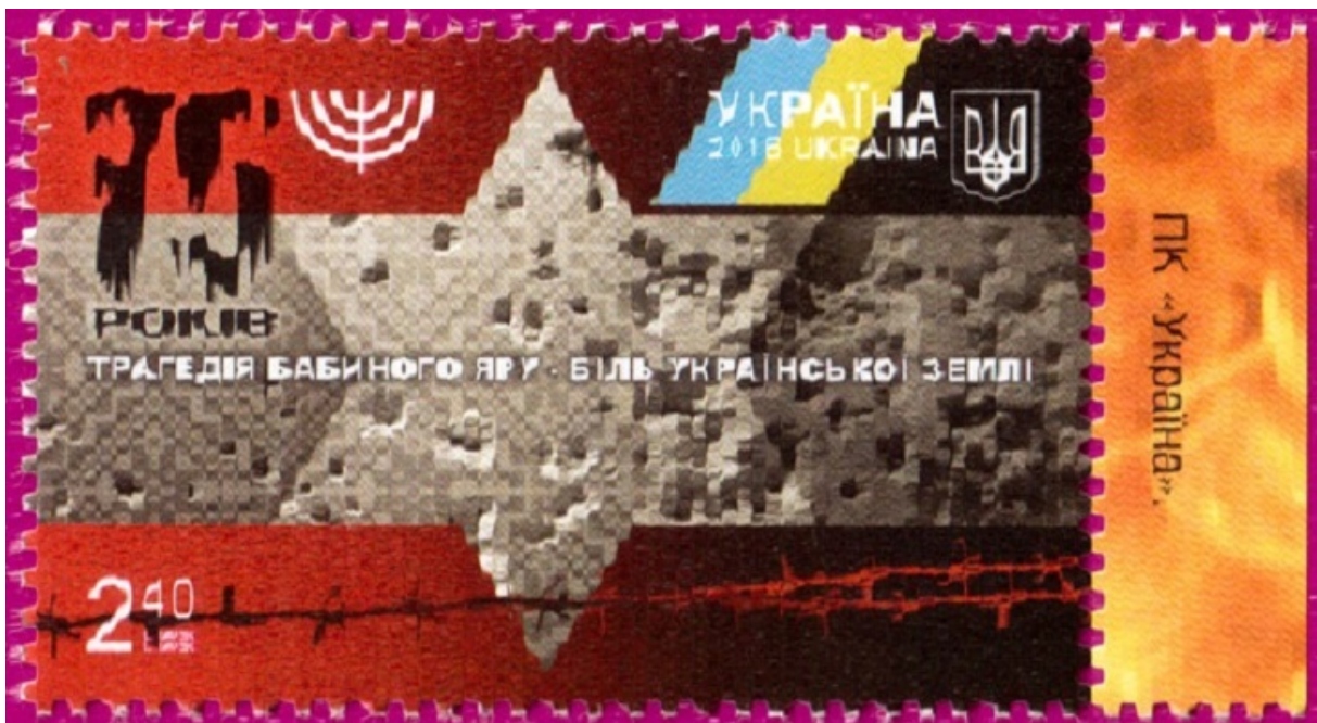
Марка, випущена до 75-річчя трагедії Бабиного Яру

Таким чином, фактично влада віддала підготовку до 80-річчя початку трагедії в руки керівництва російського проекту меморіалізації, природньо, розраховуючи, в тому числі, «зеконормити» на підготовці меморіальних заходів. Нагадую, що п'ять років тому з держбюджету було виділено на такі ж цілі і витрачено близько 30 млн грн. На ініціативи громадянського суспільства пішло куди більше, тільки канадська організація UJE (президент — Джемс Тімертей) витратила на зазначені проекти близько 1 млн доларів.