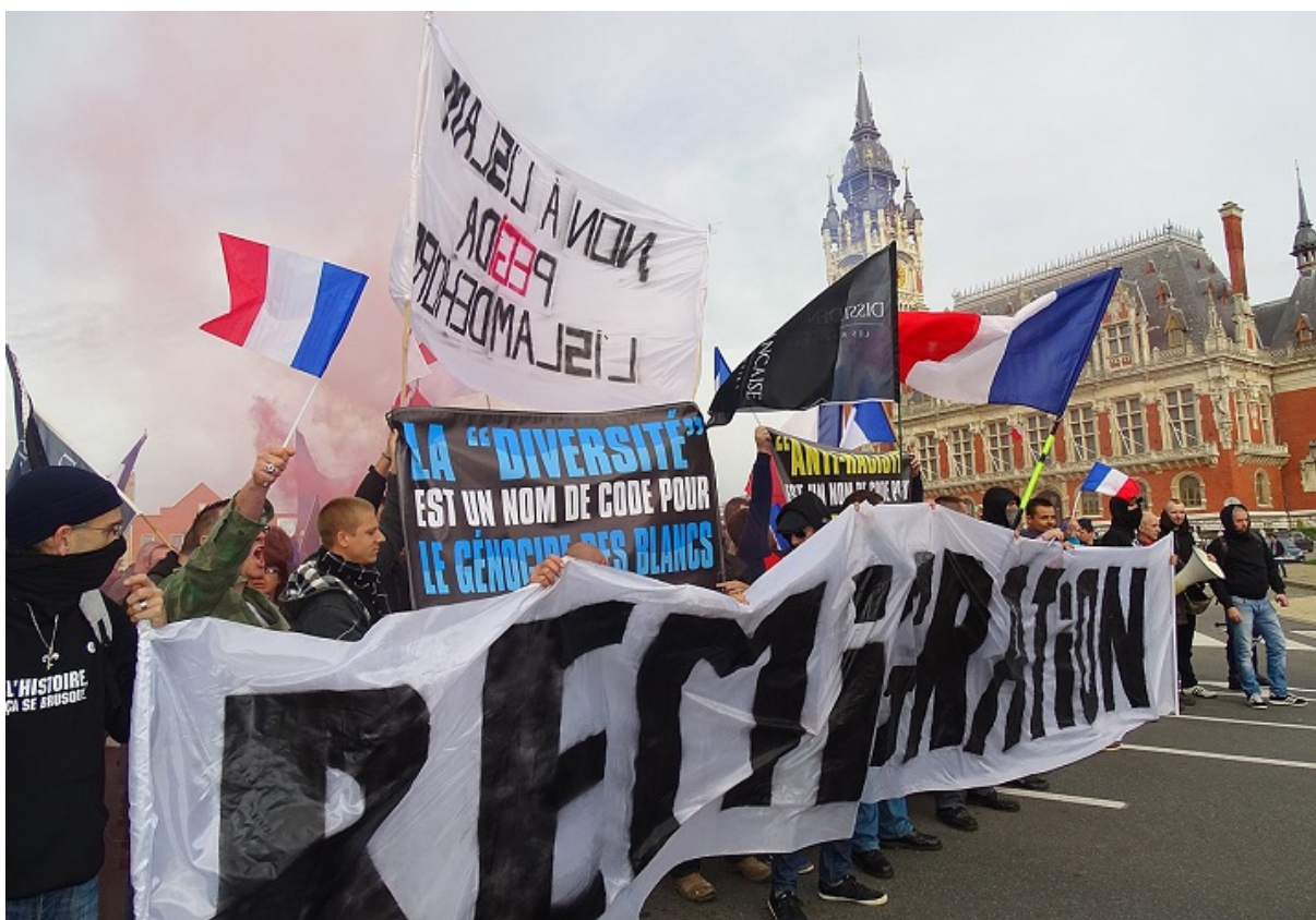
Мітинг у Кале проти імміграції, 2015

1 жовтня 2020 року прокуратура відкрила кримінальне провадження за підбурювання до ненависті після того як публіцист назвав усіх іммігрантів «зłodіями, вбивцями і гвалтівниками» й зазначив, що «всі вони підлягають депортації». Сам він оголошує себе «не злочинцем, а дисидентом», який виступає за «велич Франції, силу держави й повагу до французької культурної традиції». Крім антиісламської риторики журналіст відомий як сексист, євроскептик та критик ліберальних цінностей.