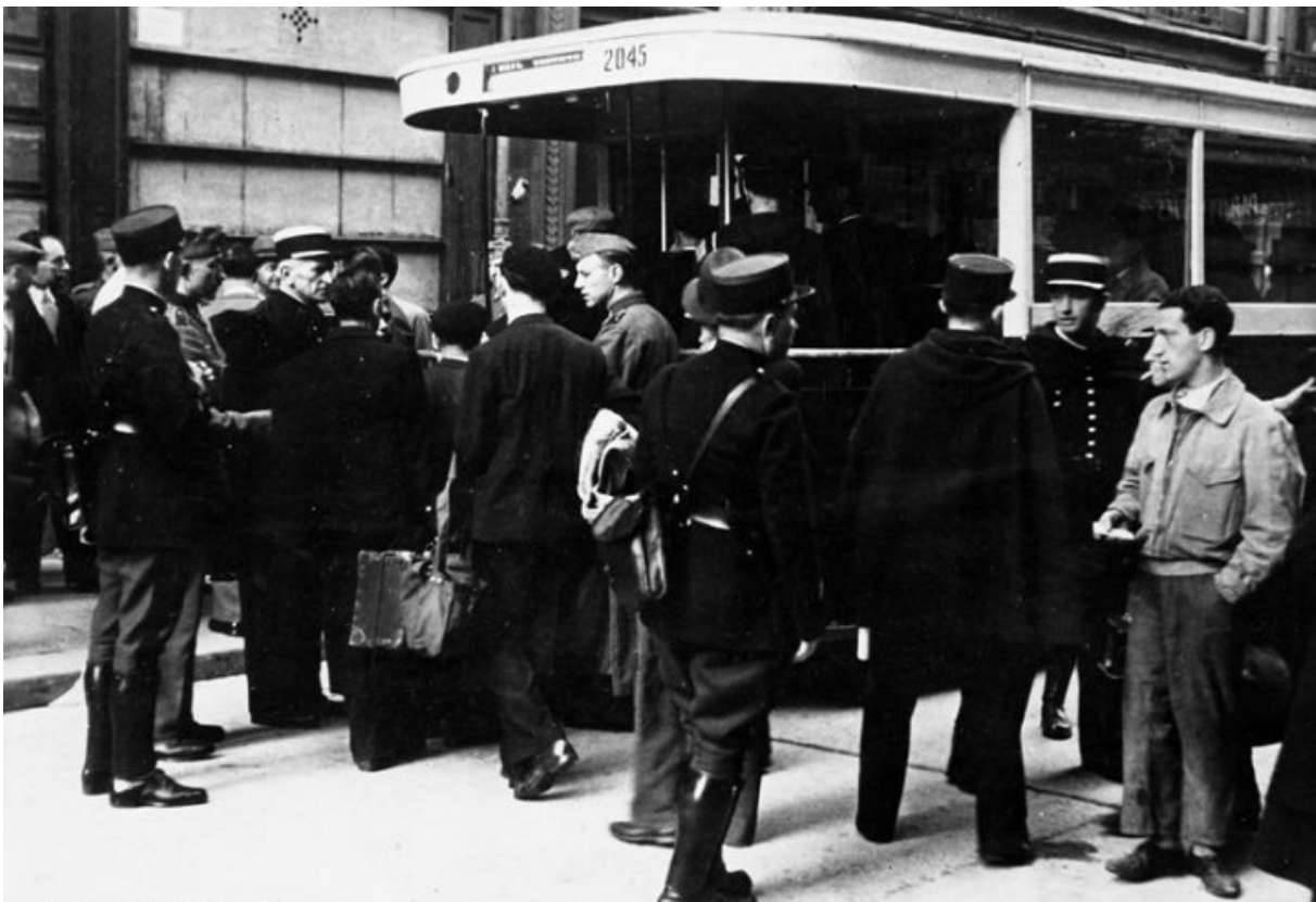
Облава на євреїв у Парижі, серпень 1941

З 2010 року Еріка часто притягають до відповідальності за неоднозначні висловлювання. Критикують його і єврейські організації Франції, в основному за обілення режиму Віші, який нібито «намагався врятувати» французьких євреїв від нацистських таборів смерті і ... став жертвою історичної ортодоксії, яка розглядає колаборантський режим у термінах «абсолютного зла».