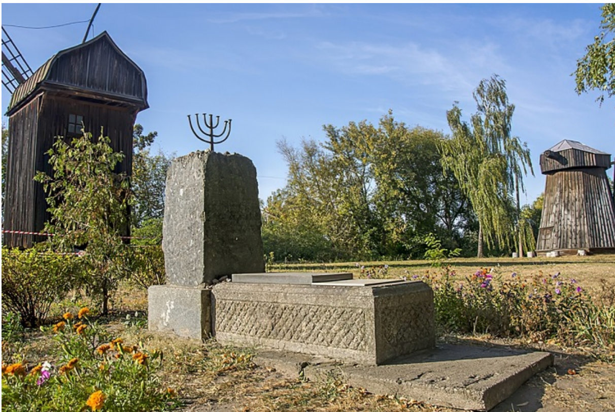
Пам'ятний знак на території колишнього єврейського кладовища

Поховали їх на єврейському цвинтарі, знищеному 1956-го за наказом виконкому. Тоді ж бульдозером знесли всі мацеви, а на місці цвинтаря звели Музей народної архітектури та побуту Середньої Наддніпрянщини. Але досі могильними плитами вистелені укоси пагорба, на якому знаходиться музей. Залишився лише пам'ятний знак цьому цвинтарю, встановлений свого часу Єврейським фондом України.