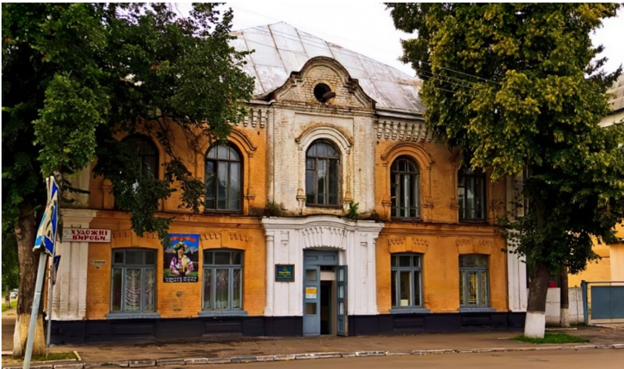
Будівля колишньої синагоги у Переяславі