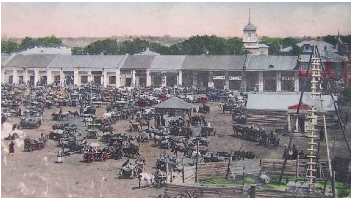
Базарна площа Переяслава на початку ХХ століття