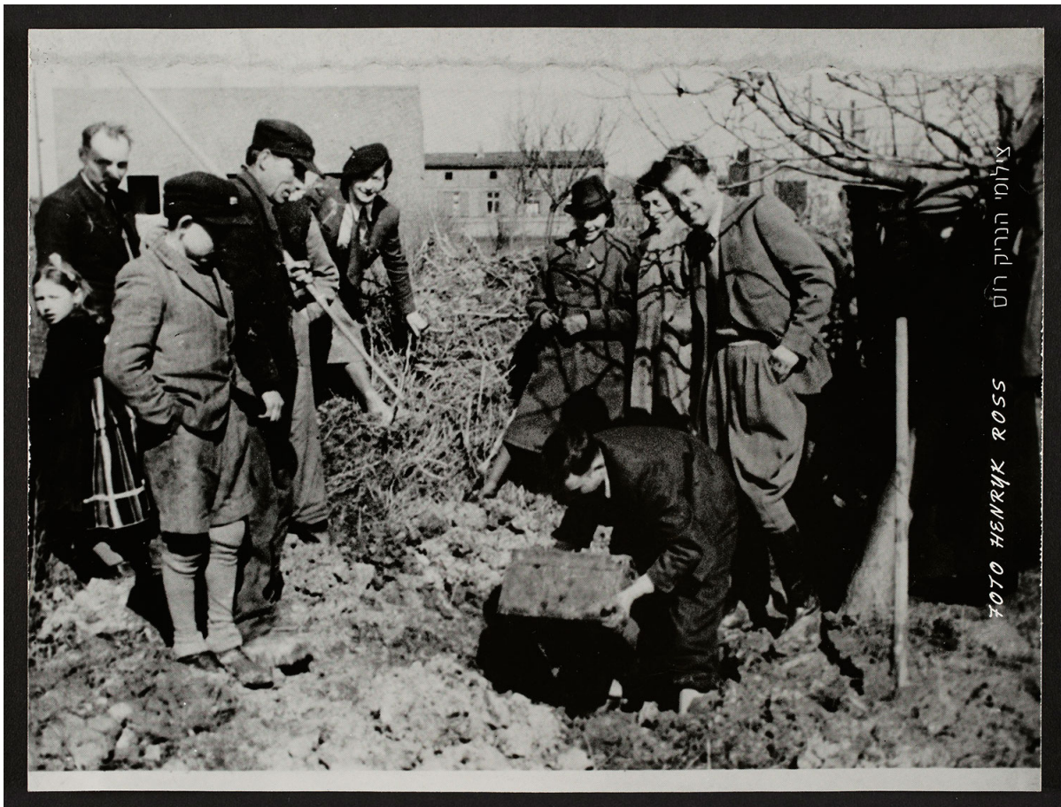
Коробку с негативами Генрика Росса извлекают из тайника, март 1945