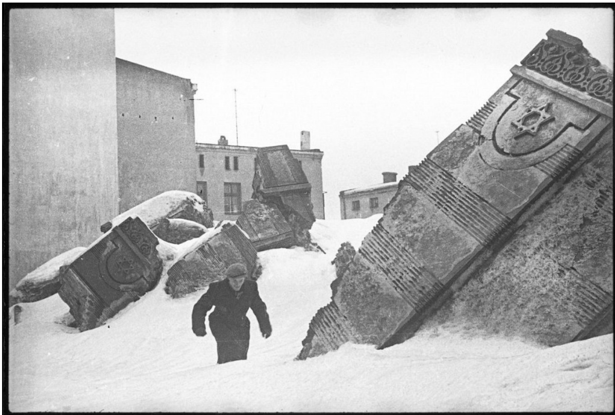
Мужчина, идущий по Вольборской улице через развалины синагоги, разрушенной немцами