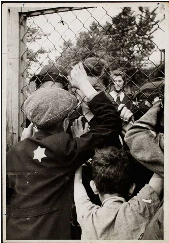
Перед депортацией. Сборный пункт на ул. Чарнецкая