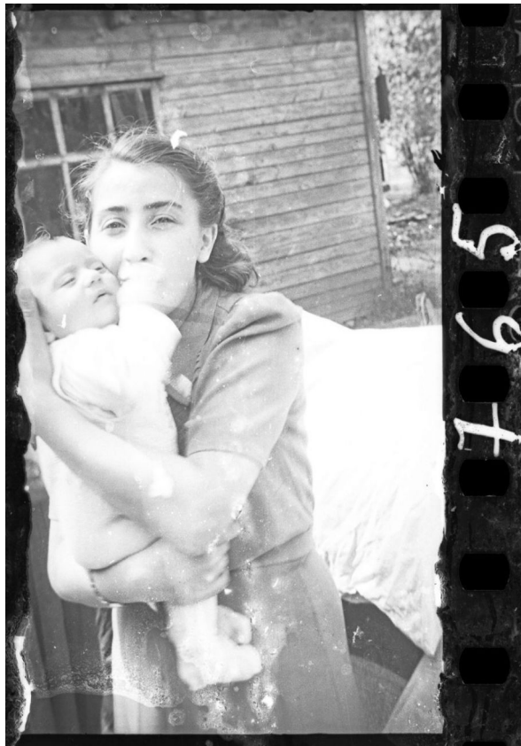
Жена и ребенок еврейского полицая

Параллельно он, рискуя жизнью, через щели в стенах, в дверях и из складок своего пальто документировал реалии гетто. Снимал голод, болезни, депортации в лагеря смерти и редкие минуты радости — спектакли, праздники, свадьбы.