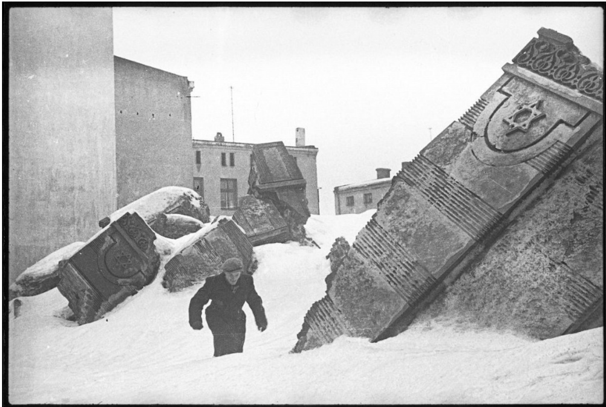
Мужчина, идущий по Вольборской улице через развалины синагоги, разрушенной немцами