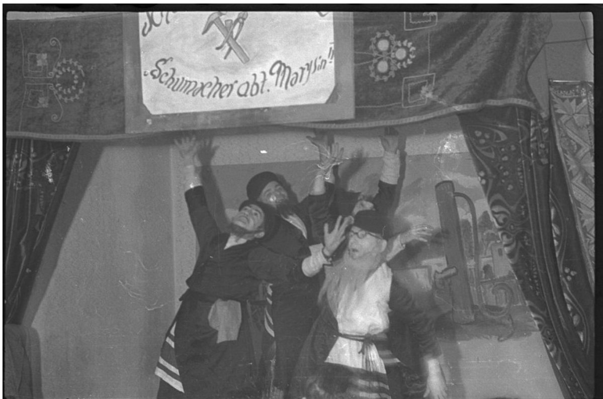
Спектакль «Сапожник из Марысина»

Депортации в Освенцим и Хелмно начались в 1942 году и продолжались вплоть до ликвидации гетто в 1944-м. Когда стало ясно, что со дня на день самого Росса могут депортировать, он собрал 6000 своих негативов в законопаченный ящик и закопал его возле своего дома на Ягеллонской улице в надежде, что когда-нибудь снимки найдут. «Я предполагал, что польское еврейство уничтожат полностью, и хотел оставить свидетельство нашего мученичества», — вспоминал он позднее.